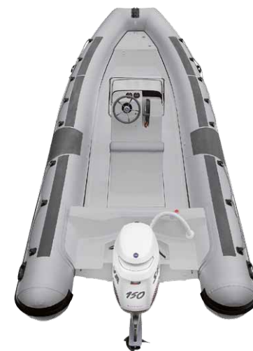
MODELLO 700 PRO