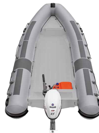
MODELLO 480 PRO