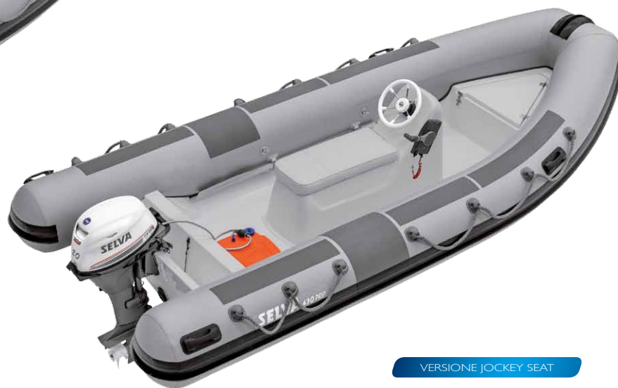
VERSIONE JOCKEY SEAT