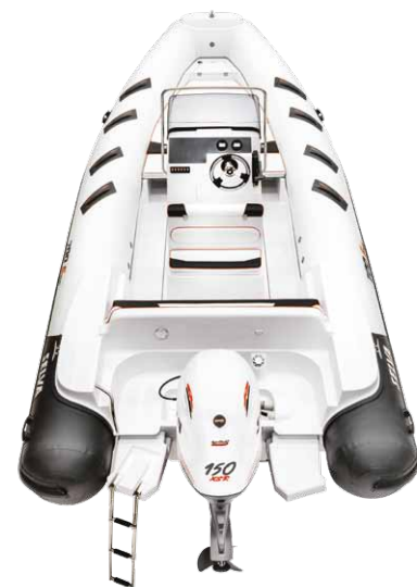
MODELLO D.700 SPECIAL