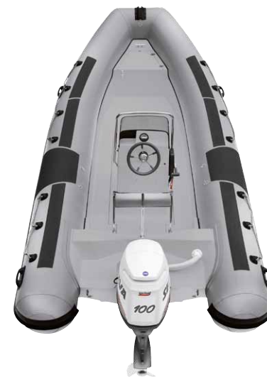
MODELLO 550 PRO