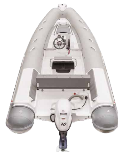
MODELLO 570 SPORT