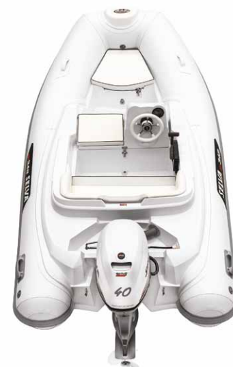
MODELLO GT 342