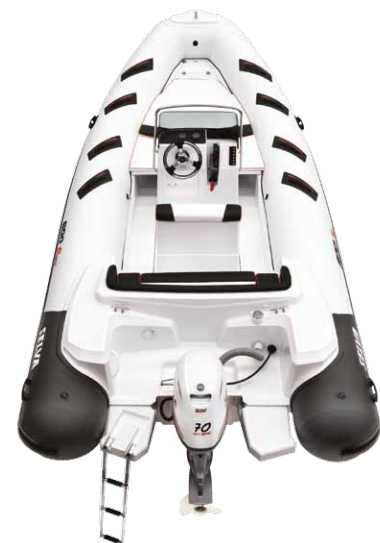
MODELLO D.600 SPECIAL